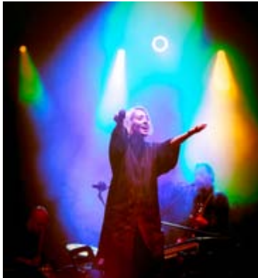
Znakomity występ Natalii Przybysz