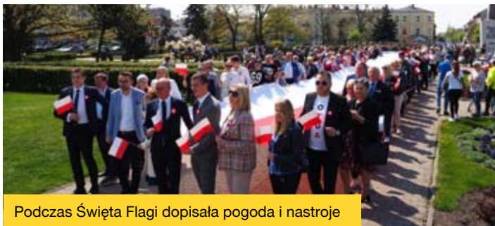
Podczas Święta Flagi dopisała pogoda i nastroje