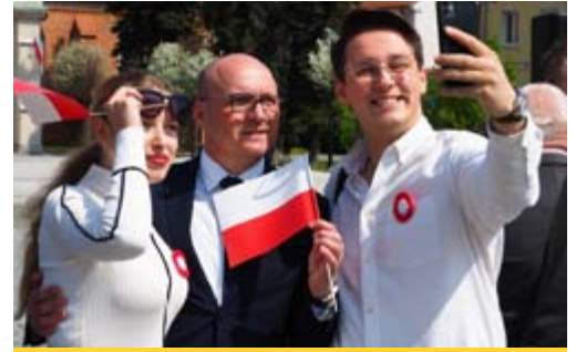
Podczas Święta Flagi dopisała pogoda i nastroje