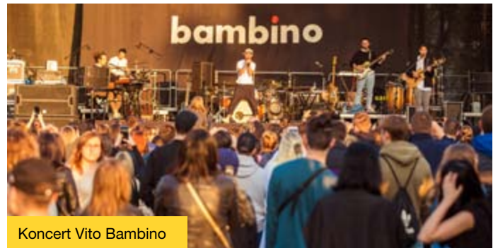
Koncert Vito Bambino