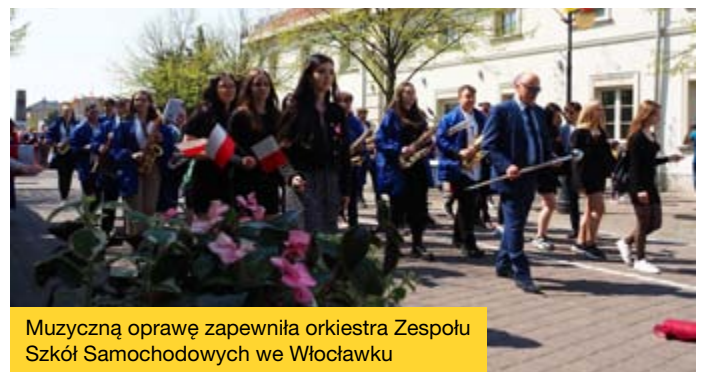
Muzyczną oprawę zapewniła orkiestra Zespołu Szkół Samochodowych we Włocławku