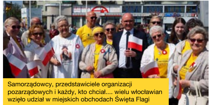
Samorządowcy, przedstawiciele organizacji pozarządowych i każdy, kto chciał.... wielu włocławian wzięło udział w miejskich obchodach Święta Flagi