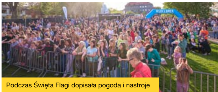
Podczas Święta Flagi dopisała pogoda i nastroje