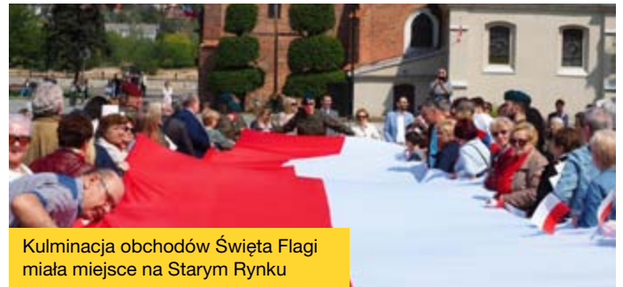
Kulminacja obchodów Święta Flagi miała miejsce na Starym Rynku