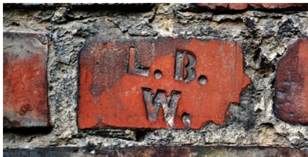
Sygnatura cegielni parowej Leona Bojańczyka na oficynie kamienicy przy Zielonym Rynku 7