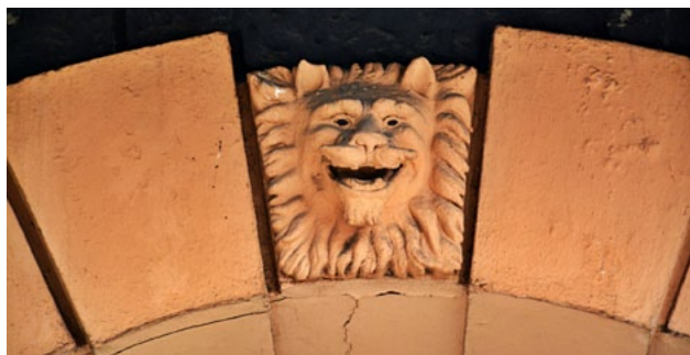
Uśmiechnięty lew nad prześwitem bramnym, ul. Piekarska 4

Specjalnej Strefy Ekonomicznej, stypendium Prezydent Miasta Łodzi oraz licznych wyróżnień za działalność społeczną. Wielokrotnie występowała w mediach i na konferencjach jako ekspertka ds. dziedzictwa kulturowego i jego promocji. Doktorantka w Szkole Doktorskiej Nauk Humanistycznych Uniwersytetu Łódzkiego. Producentka gry planszowo-karcianej „Łowcy Detalu. Łódź”. W latach 2020-21 r. opracowała m.in. 19 szlaków i filmów śladami detalu architektonicznego w miastach województwa łódzkiego, obecnie pracuje nad projektami wykorzystującymi detale w procesach rewitalizacji miast.