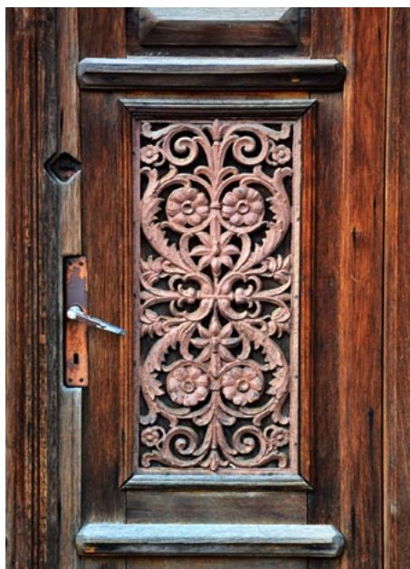
Ozdobna krata w skrzydle drzwi willi Hugona Müshama przy ul. Kościuszki 2