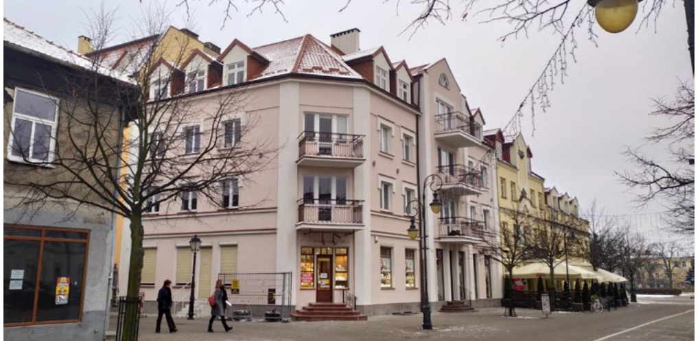
3 Maja 35 to kolejna nieruchomość na liście ubiegłorocznych dotacji do remontu z Urząd Miasta Włocławek. Wspólnota mieszkaniowa uzyskała dotację na tynkowanie i malowanie elewacji, remont blacharki, remont balkonów oraz remont lukarnów.

Więcej informacji można znaleźć na stronie rewitalizacja.wloclawek.eu w zakładce: Specjalna Strefa Rewitalizacji.