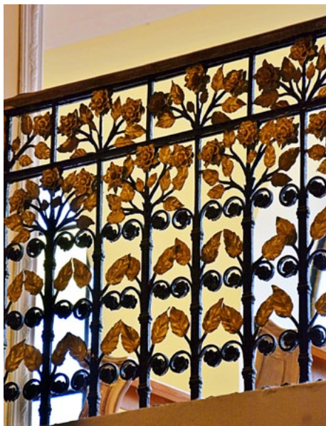
Krata z motywem kwiatów we wnętrzu kościoła franciszkanów pw. Wszystkich Świętych przy pl. Wolności 6