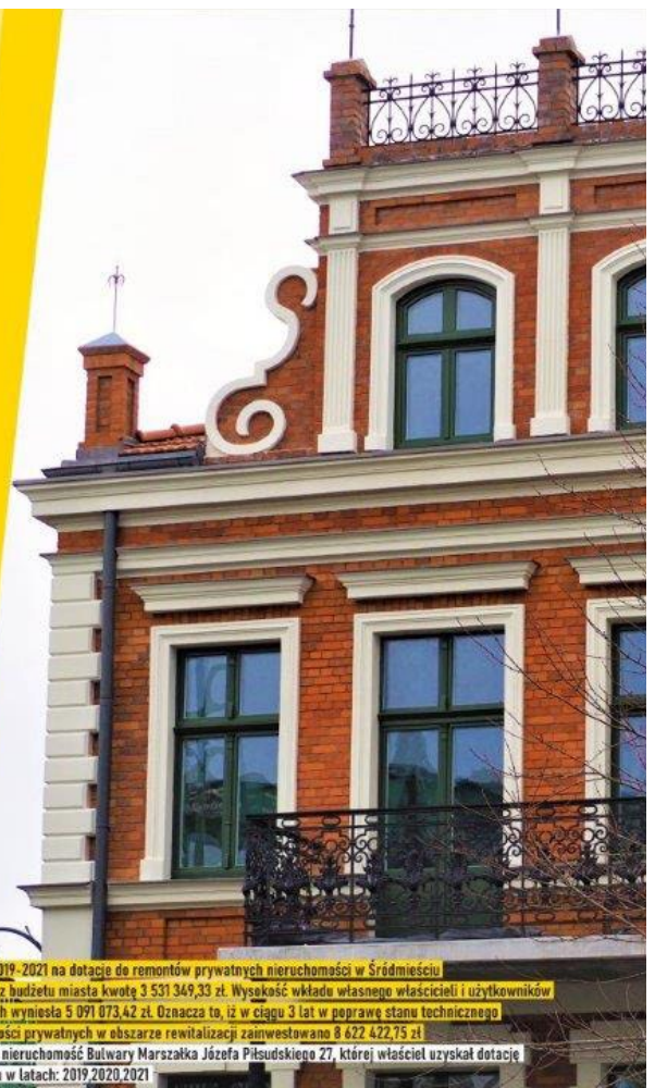
W latach 2019-2021 na dotację do remontów prywatnych nieruchomości w Śródmieściu przyznano z budżetu miasta kwotę 3 531 349,33 zł. Wysokość wkładu własnego właścicieli i użytkowników wieczystych wyniosła 5 091 073,42 zł. Oznacza to, iż w ciągu 3 lat w poprawę stanu technicznego nieruchomości prywatnych w obszarze rewitalizacji zainwestowano 8 622 422,75 zł. Na zdjęciu: nieruchomość Bulwary Marszałka Józefa Piłsudskiego 27, której właściciel uzyskał dotację do remontu w latach: 2019, 2020, 2021.