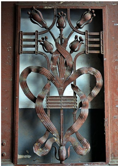
Secesyjna dekoracja w skrzydle bramy przy Zielonym Rynku 7