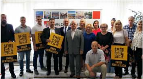
W 2019 roku dotacje do remontów otrzymali właściciele lub użytkownicy wieczyści 6 nieruchomości