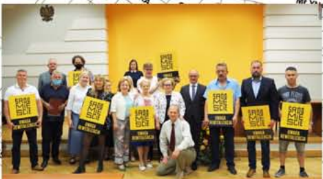
W 2020 roku dotacje do remontów otrzymali właściciele lub użytkownicy wieczyści 10 nieruchomości