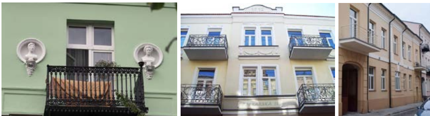
Dzięki miejskiej dotacji wypiękniaty między innymi elewacje kamienic przy ul. Łęgskiej 77, Piekarskiej 15 oraz 3 Maja 10/12.

Wsparcie udzielane jest, w zależności od wybranego programu dotacyjnego, w wysokości do 50 procent nakładów koniecznych. Wnioski można składać do 1 marca 2024 r.