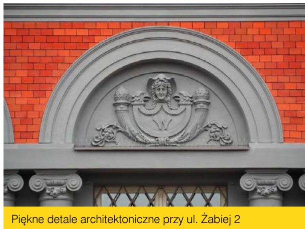
Piękne detale architektoniczne przy ul. Żabiej 2

O pięknym Włocławku, z niezwykłymi osobami rozmawiała: Aleksandra Bartoszevska