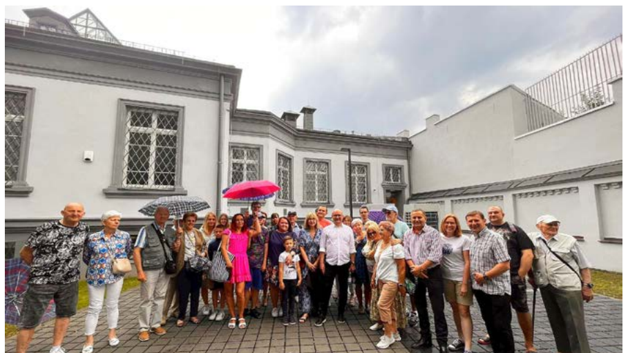
Ostatni przystanek spaceru, dziedziniec Interaktywnego Centrum Fajansu przy ul. Żabiej.