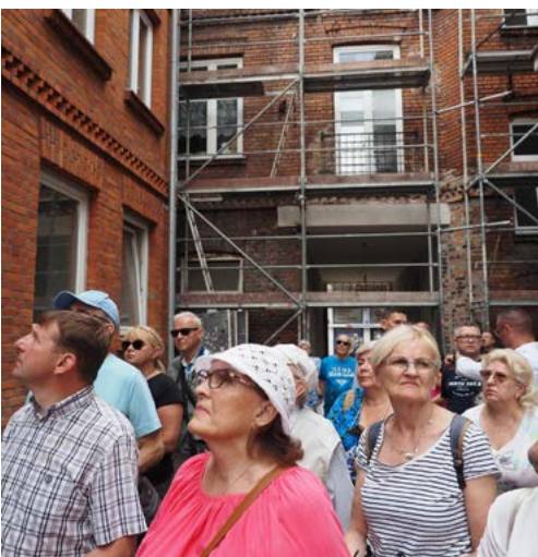
Uczestnicy zachwycali się architekturą przedwojennej kamienicy przy ul. Piekarskiej 15.