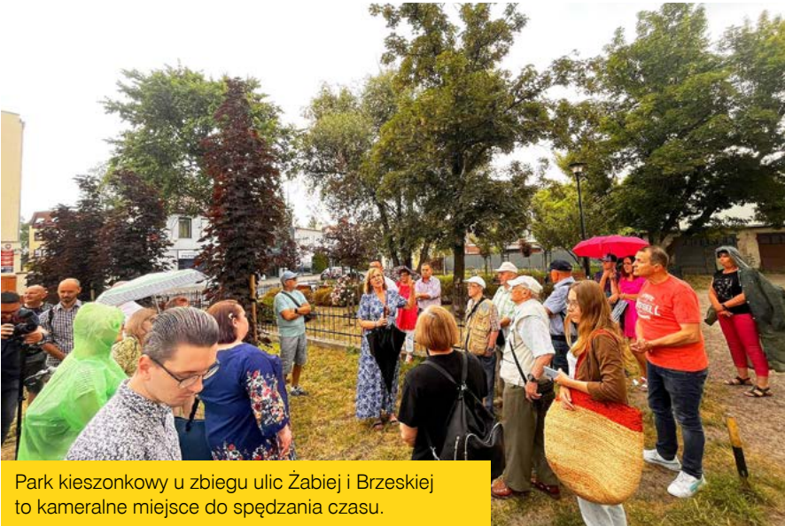
Park kieszonkowy u zbiegu ulic Żabiej i Brzeskiej to kameralne miejsce do spędzania czasu.

Ważnym punktem odwiedzin była kawiarnia obywatelska „Śródmieście Cafe”, którą mieszkańcy Włocławka bardzo polubili. Spotkania, koncerty, zajęcia dla dzieci, akcje społeczne, treningi sportowe, a przede wszystkim liczni goście – długo by wymieniać wszystkie projekty, które w kawiarence się odbywają. Na finiszu, zmęczeni ale szczęśliwi spacerowicze dotarli do Skarbca Fajansu przy ul. Żabiej. To nowoczesne, Interaktywne Centrum i zarazem jedna z najważniejszych inwestycji w ramach Gminnego Programu Rewitalizacji. Jesienią tego roku Skarbiec Fajansu zaprosi pierwszych zwiedzających.