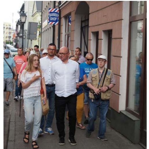
Spacer był okazją do zwiedzania, ale także do rozmów o mieście.