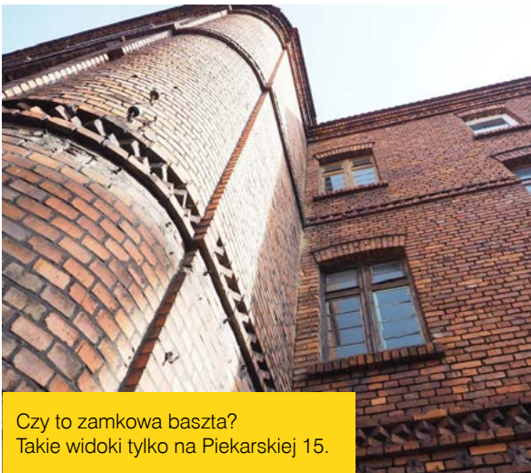
Czy to zamkowa baszta? Takie widoki tylko na Piekarskiej 15.