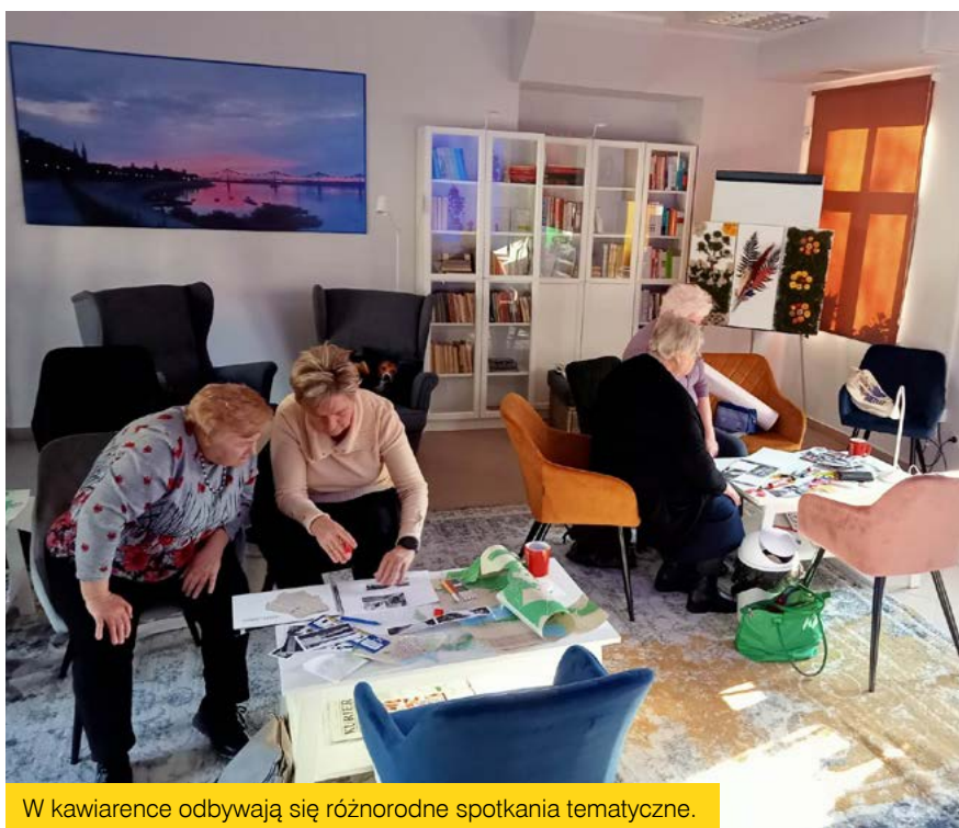
W kawiarence odbywają się różnorodne spotkania tematyczne.

Projekty „Kawiarenka międzypokoleniowa- rozwój osobisty w duchu zero-waste”, umowa nr 24/G/2022/013 oraz „Kawiarenka międzypokoleniowa- rozwój osobisty w duchu różnorodności”, umowa nr 25/G/2022/013 realizowane są przez Gminę Miasto Włocławek/ Włocławskie Centrum Organizacji Pozarządowych i Wolontariatu w ramach Lokalnej Strategii Rozwoju na lata 2016-2023 Stowarzyszenia LGD Włocławek, współfinansowane z EFS w ramach Osi priorytetowej 11. Rozwój Lokalny Kierowany przez Społeczność Działanie 11.1 Włączenie społeczne na obszarach objętych LSR Regionalnego Programu Operacyjnego Województwa Kujawsko – Pomorskiego na lata 2014 – 2020.