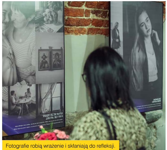
Fotografie robią wrażenie i skłaniają do refleksji.