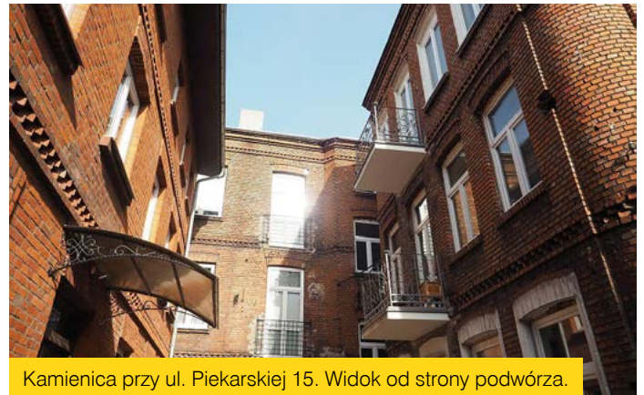
Kamienica przy ul. Piekarskiej 15. Widok od strony podwórza.