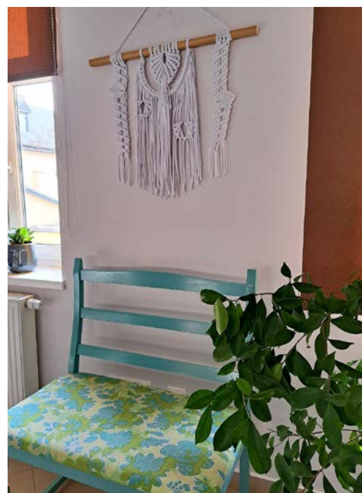
Makrama i ławeczka jak dzieła sztuki. Taki uroczy kącik!