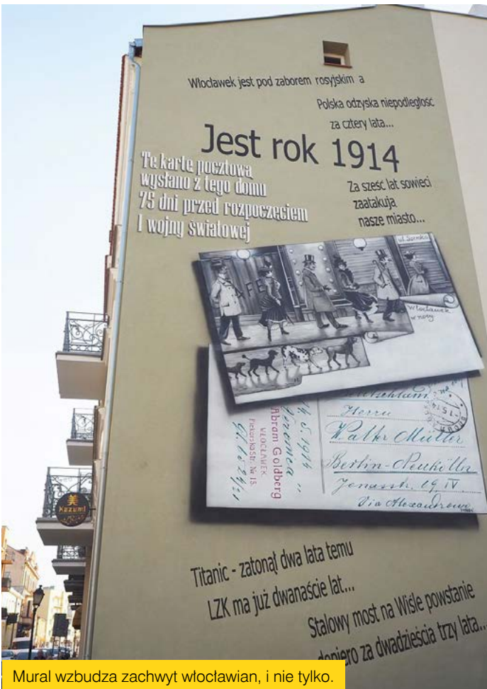
Mural wzbudza zachwyt włocławian, i nie tylko.