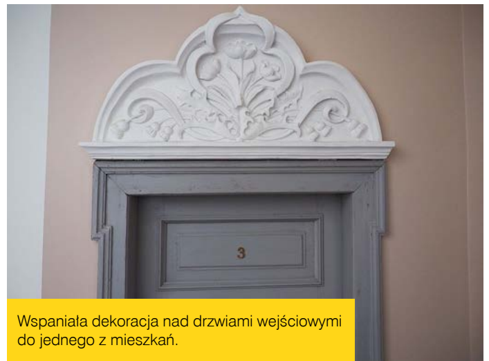
Wspaniała dekoracja nad drzwiami wejściowymi do jednego z mieszkań.