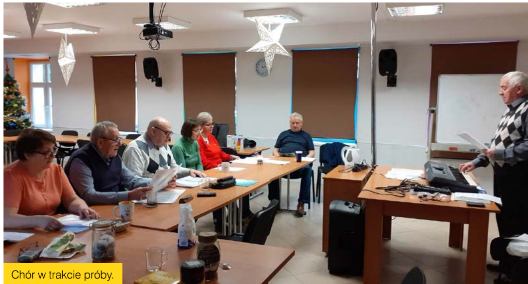
Chór w trakcie próby.

Warto wspomnieć, że w Centrum działa Punkt Adopcji Roślin. Roślinkę, z którą nie wiemy co zrobić lub nie mamy dla niej odpowiedniego miejsca, można podarować. Redakcja „Gazety Śródmiejskiej”