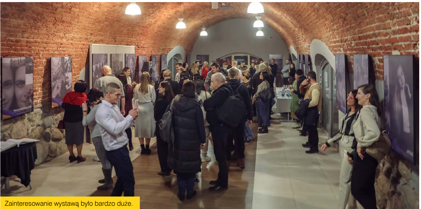
Zainteresowanie wystawą było bardzo duże.