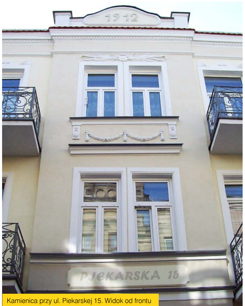
Kamienica przy ul. Piekarskiej 15. Widok od frontu