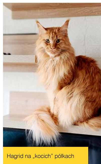
Hagrid na „kocich” półkach

Wracając do tytułowego pytania: co ma wspólnego rewitalizacja Włocławka z kocimi gustami, wystarczy się rozejrzeć, by uświadomić sobie, że żyjemy po sąsiedzku także z czworonożnymi mieszkańcami Śródmieścia. Odnawiając budynki, właściciele i zarządcy coraz częściej biorą pod uwagę zorganizowanie i udostępnienie zwierzętom ukryć, budek, miejsc do życia. Miejska natura nas otacza, a my uczymy się ją szanować.