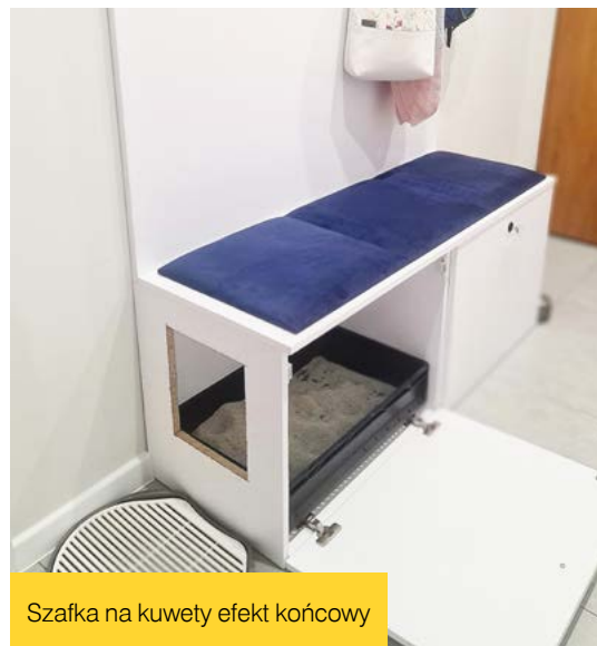
Szafka na kuwety efekt końcowy