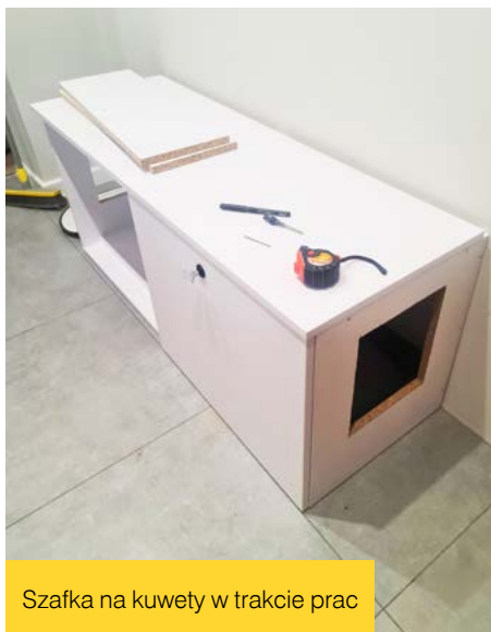
Szafka na kuwety w trakcie prac