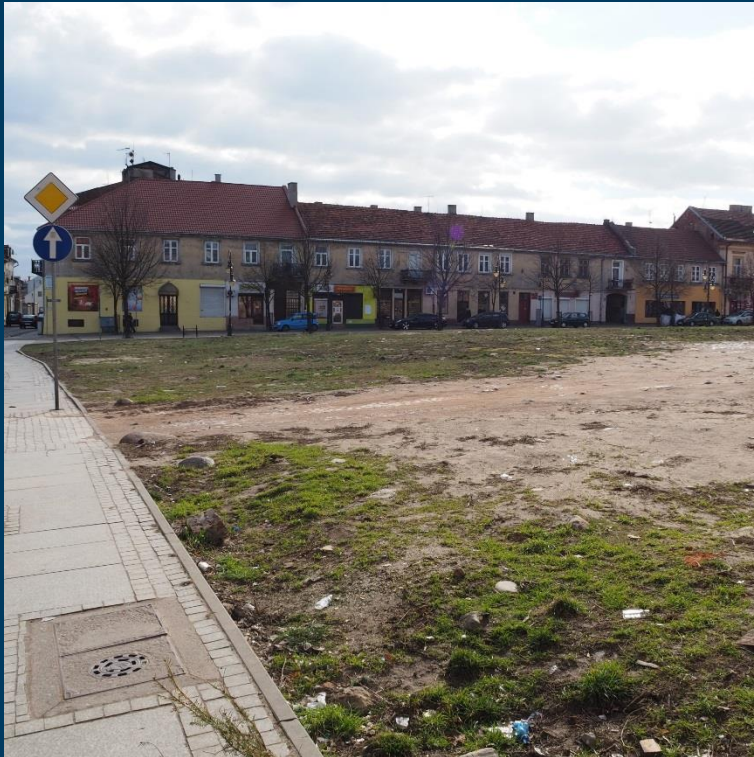
Zagospodarowanie przestrzeni miejskiej - kwartał ul. Tumskiej, 3 Maja – Cyganka - Brzeska