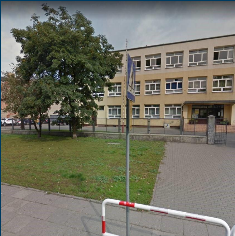
Trójka dla mieszkańców