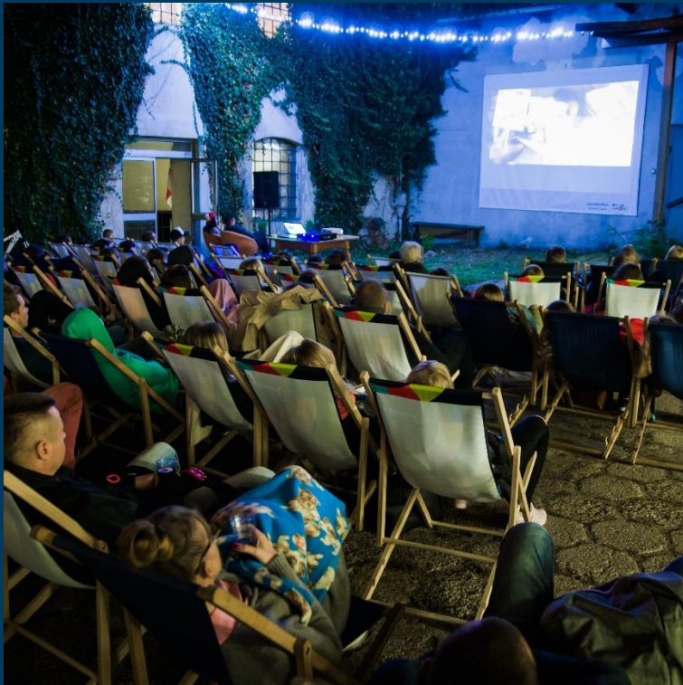
Mikrogranty w ramach Programu Wsparcia Projektów Lokalnych