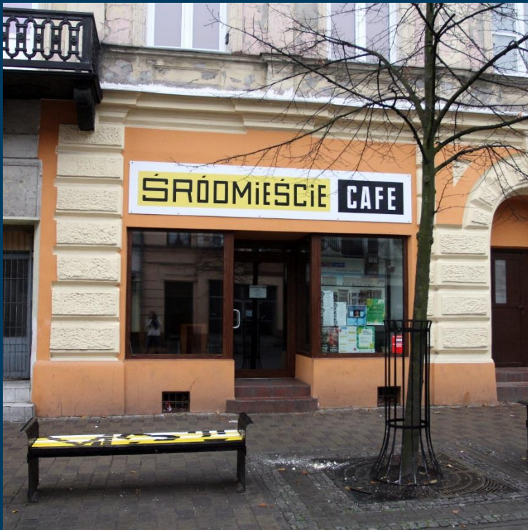
Kawiarnia obywatelska „Śródmieście Cafe”