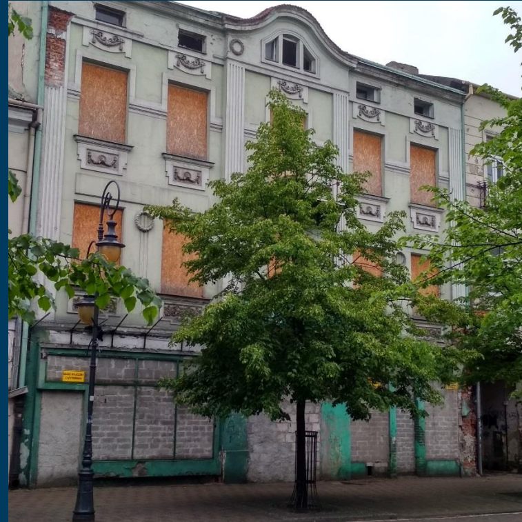
Przebudowa i zmiana sposobu użytkowania budynku przy ul. 3 Maja 18 na Centrum Aktywizacji i Przedsiębiorczości