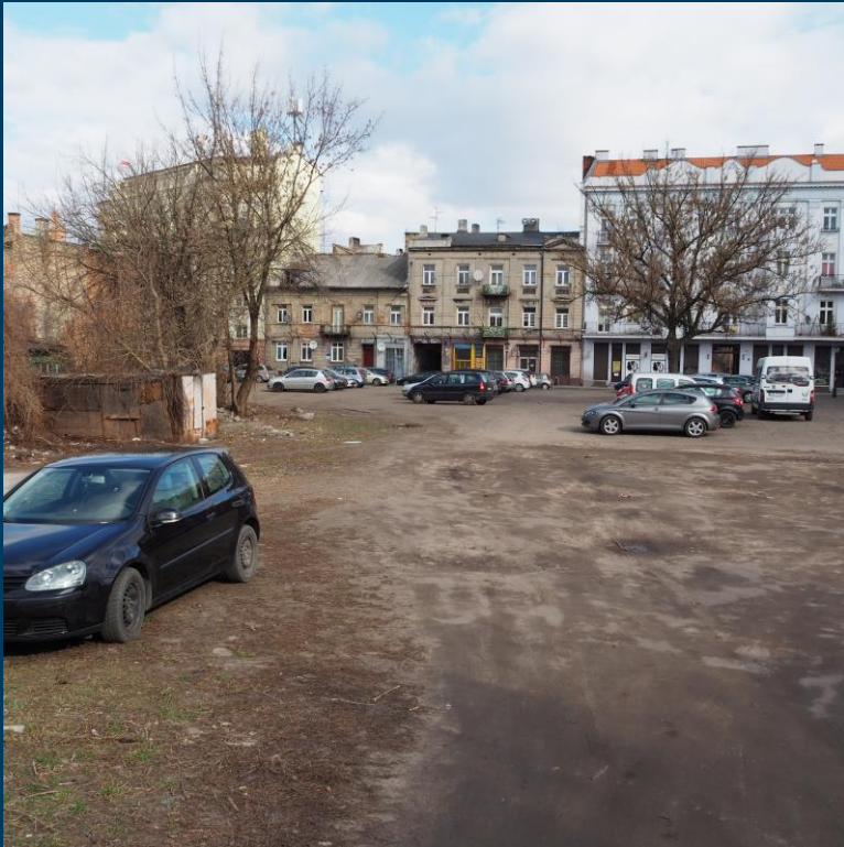
Spółeczne Budownictwo Czynszowe