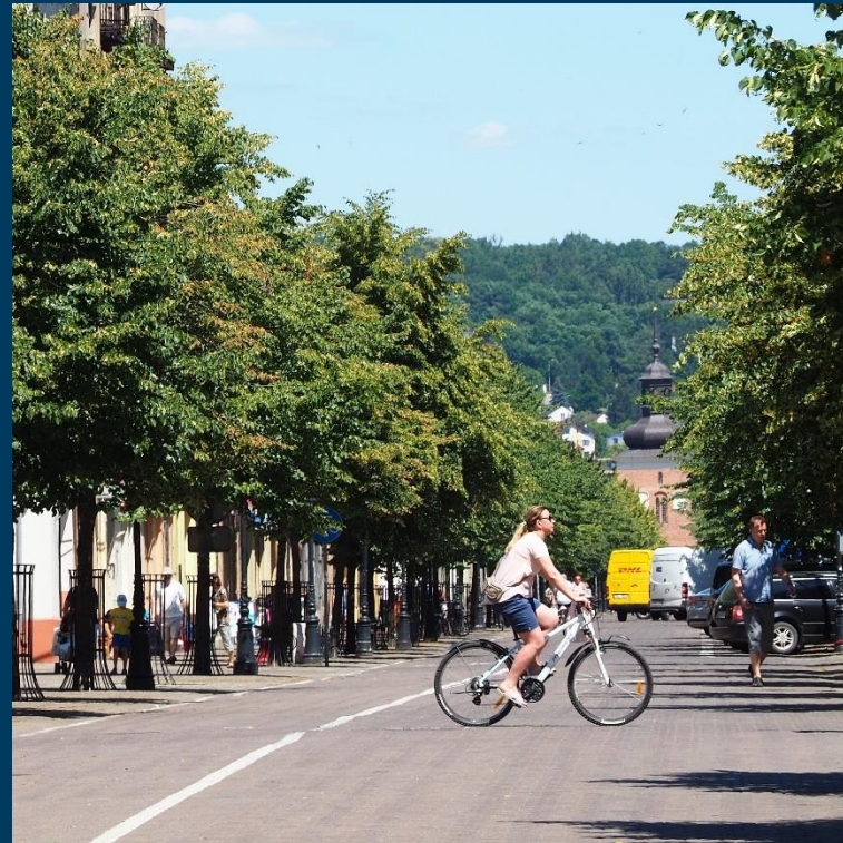
3 Maja woonerfem