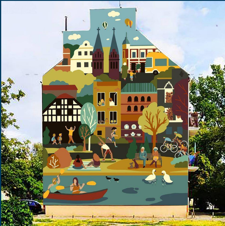
Sztuka w przestrzeni - Program Murale