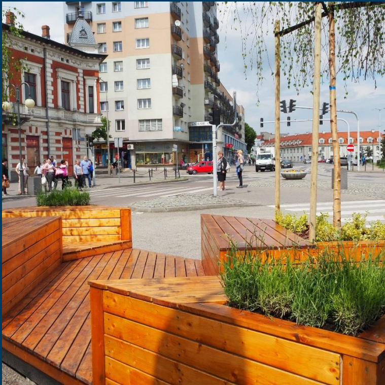
Parklety w Śródmieściu