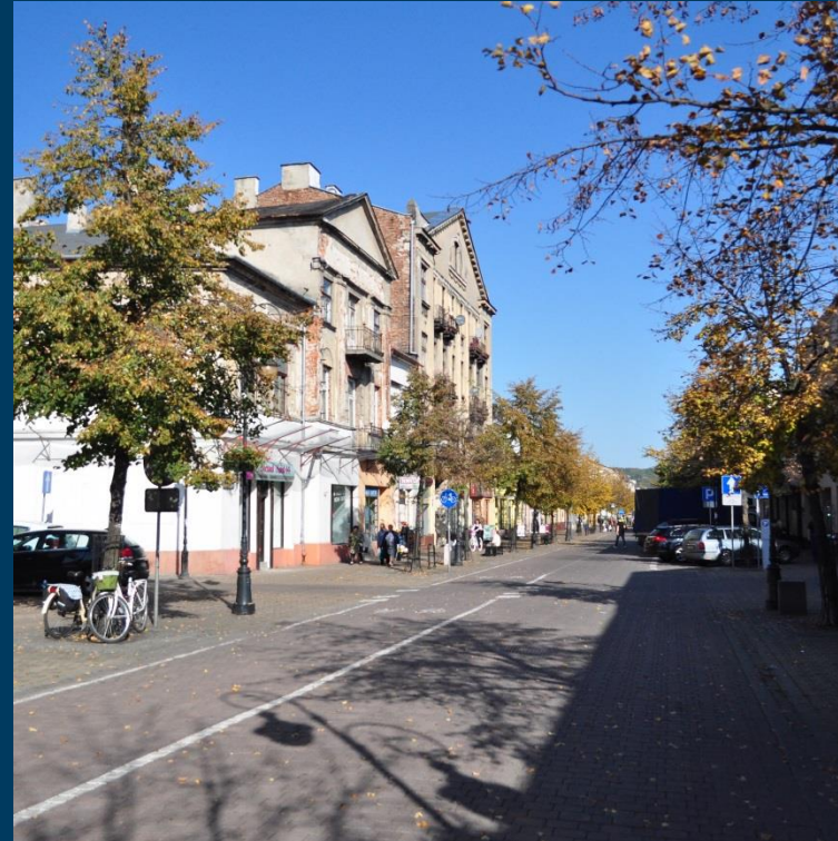
Aktywizacja zawodowa mieszkańców