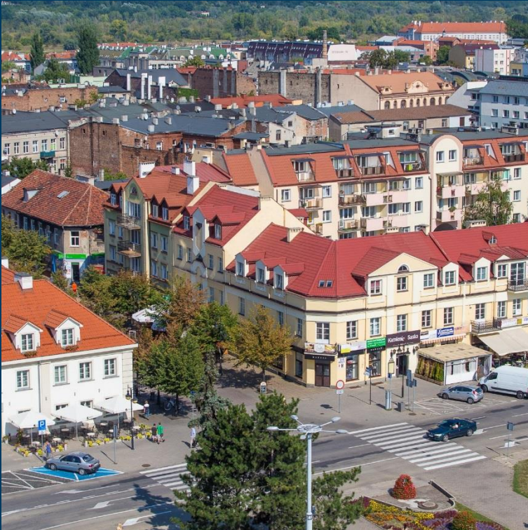
Markowy Lokal Śródmieścia