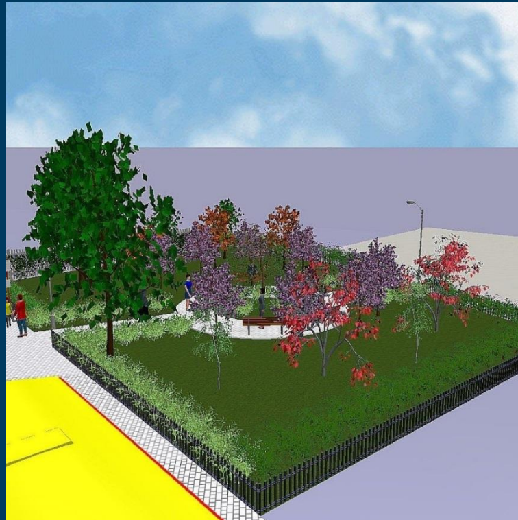
Parki kieszonkowe – kompaktowe tereny z zielenią wysoką