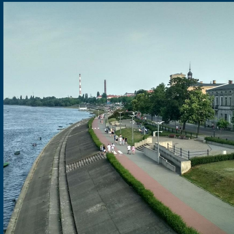
Wzbogacenie zagospodarowania bulwarów