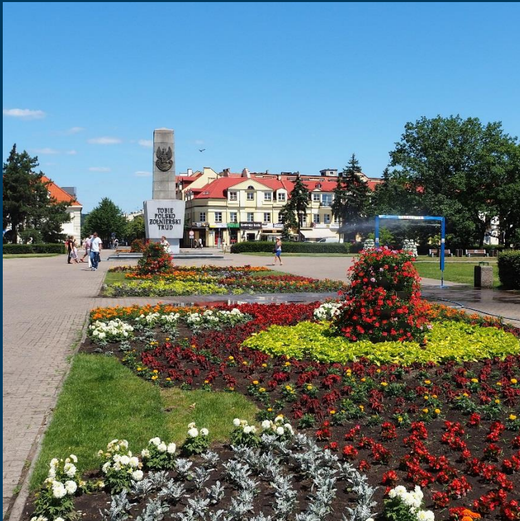
Nowe zagospodarowanie Placu Wolności