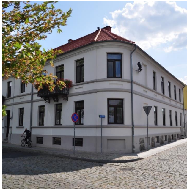
ul. Bulwary 18