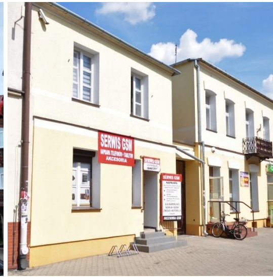
ul. Zduńska 4B