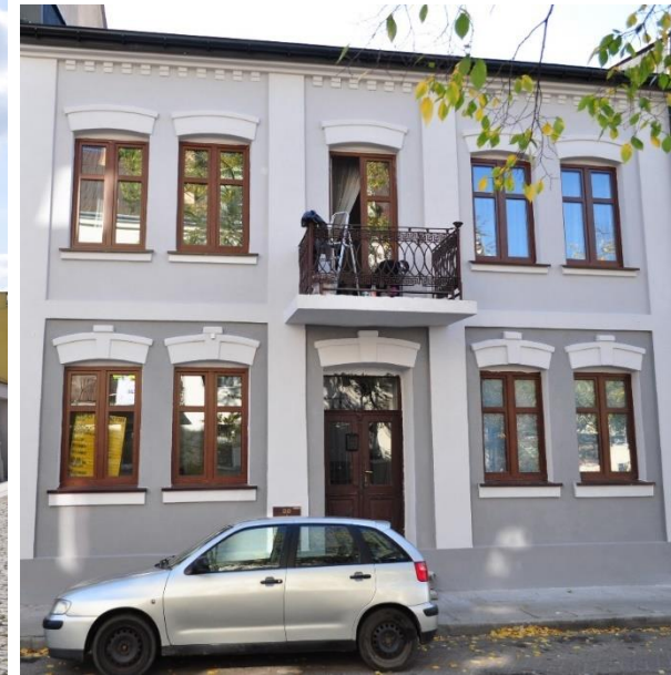
ul. Żabia 27