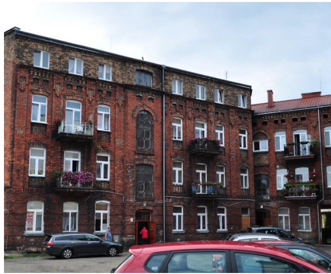
ul. Piekarska 3