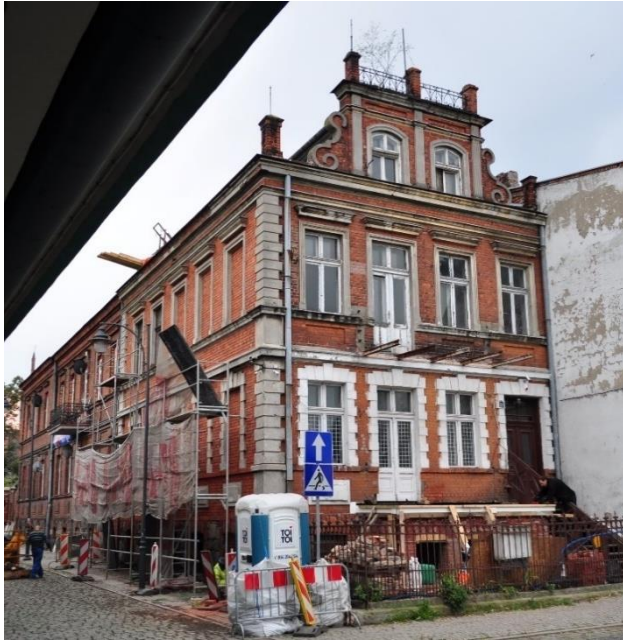
ul. Bulwary 27