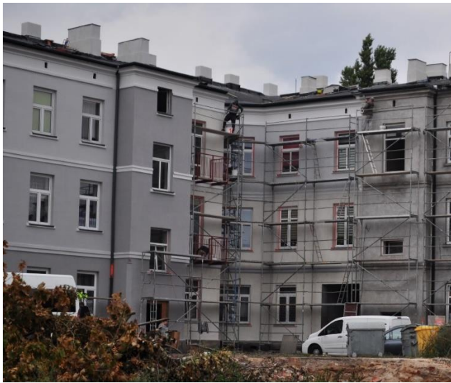
ul. Brzeska 23