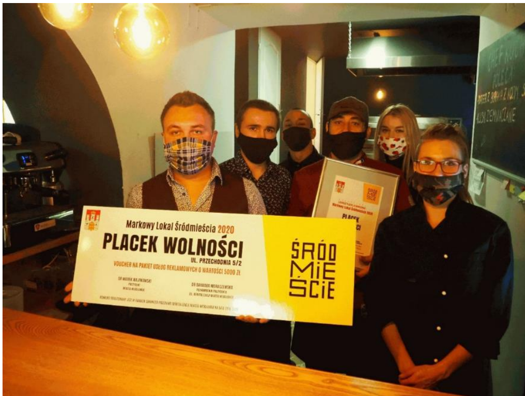
Fot. 7. Wręczenie vouchera i certyfikatu Restauracji „Placek Wolności” – zwycięzcy konkursu w ramach projektu Markowy Lokal Śródmieścia (nr 2.1.5.)

Druga edycja konkursu przeprowadzona została zgodnie z regulaminem w dniach od 1 do 21 września 2020 r. Weryfikacji formalnej i merytorycznej złożonych wniosków dokonano w dniach 22-30 września, w wyniku której 17 podmiotów poddano pod głosowanie, które odbyło się w dniach 1-14 października na stronie internetowej www.wloclawek.pl . Największą liczbę głosów zdobyła Restauracja Placek Wolności funkcjonująca przy ul. Przechodniej 5/2. Właściciel otrzymał voucher na usługi promocyjne w lokalnych mediach i certyfikat wraz z oznaczeniem na witrynie (fot. 7.).