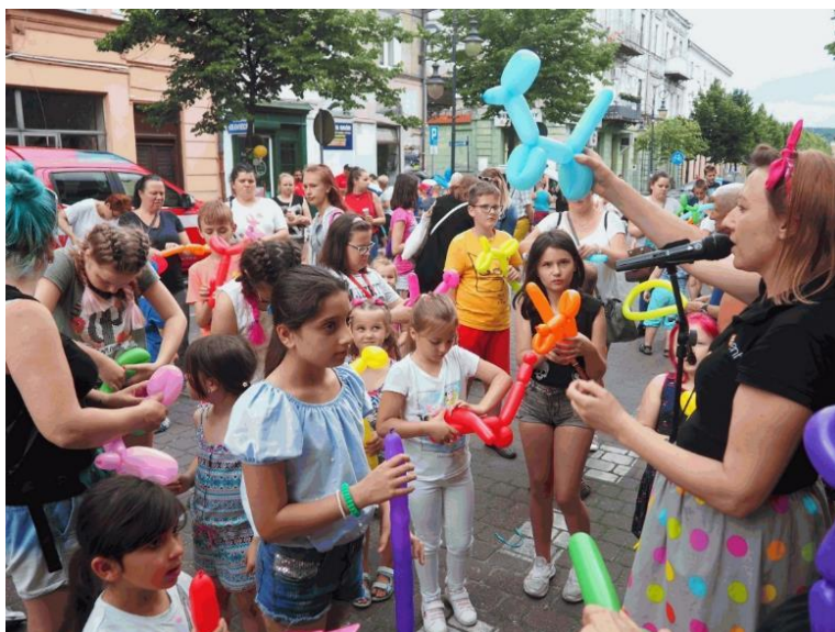
Fot. 4. Śródmiejskie powitanie wakacji realizowane przez operatora kawiarni obywatelskiej „Śródmieście Cafe” w ramach przedsięwzięcia Kawiarnia obywatelska (1.1.10.)

Na przestrzeni 11 miesięcy 2020 r. w 181 działaniach animacyjnych wzięło udział ogółem 3 203 interesariuszy rewitalizacji (rocznie zakładano realizację 36 działań animacyjnych i 5 000 osób uczestniczących w tych działaniach). Ogółem zrealizowano 448 wydarzeń, w których brało udział 17 137 osób.