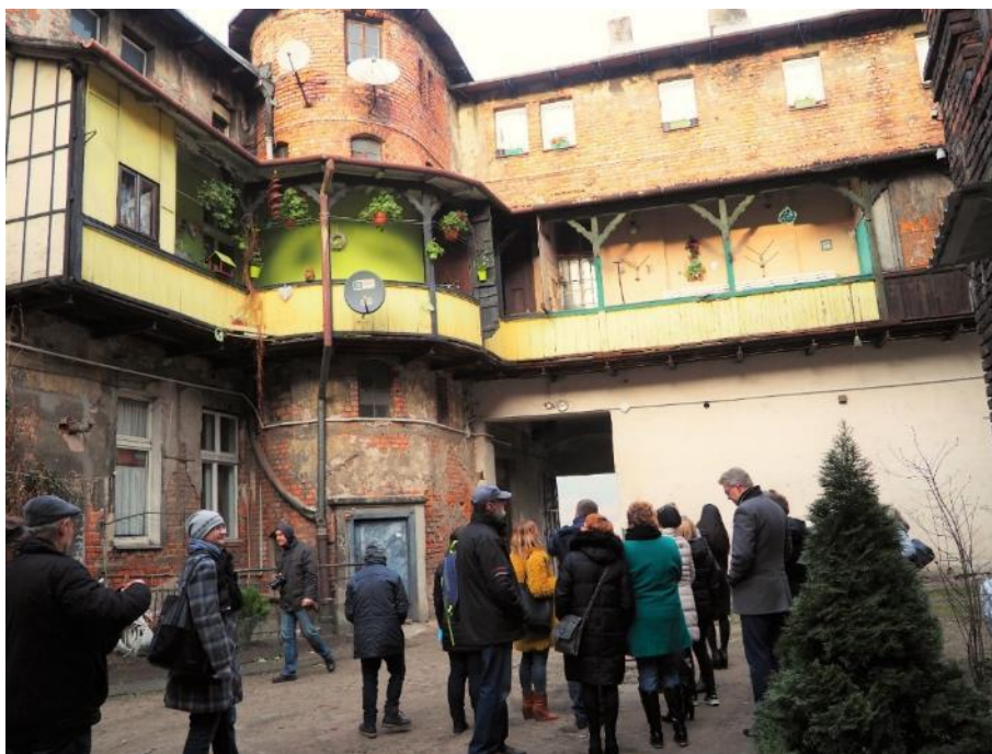
Fot. 16. Spacer Komitetu Rewitalizacji wraz z zainteresowanymi mieszkańcami po obszarze rewitalizacji w dniu 14.01.2020r.

na elewacji bocznej budynku przy ul. Żabiej 14/16, rezultaty zagospodarowania kilka tygodni wcześniej parku kieszonkowego na placu przy ul. Brzeskiej 7, a także umieszczonych w obszarze rewitalizacji tablic historyczno-informacyjnych promujących obiekty w tym obszarze.