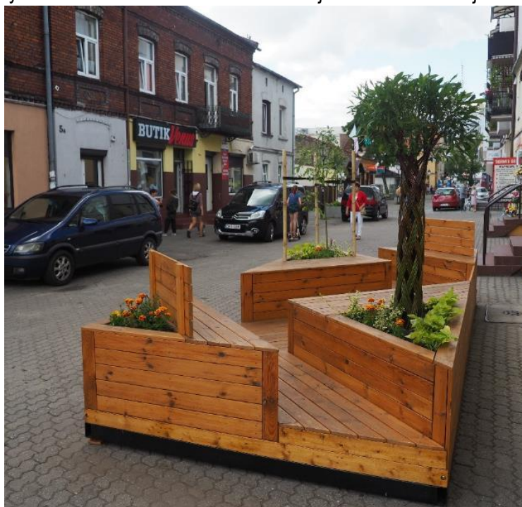
Fot. 8. Parklet przy ul. Zduńskiej w ramach przedsięwzięcia Parklety w Śródmieściu (3.1.4.)

W 2019 r. wykonana została dokumentacja projektowa parkletu o wartości 4 920,00 zł. Na podstawie dokumentacji zostały wykonane 2 sztuki parkletów o łącznej wartości 23 800,00 zł. Na okres zimowy parklety zostały przewiezione na teren Miejskiego Zakładu Zieleni i Usług Komunalnych. W okresie letnim w 2020 r. zostały rozmieszczone obszarze rewitalizacji – na ul. Zduńskiej i na Placu Wolności (fot. 8).