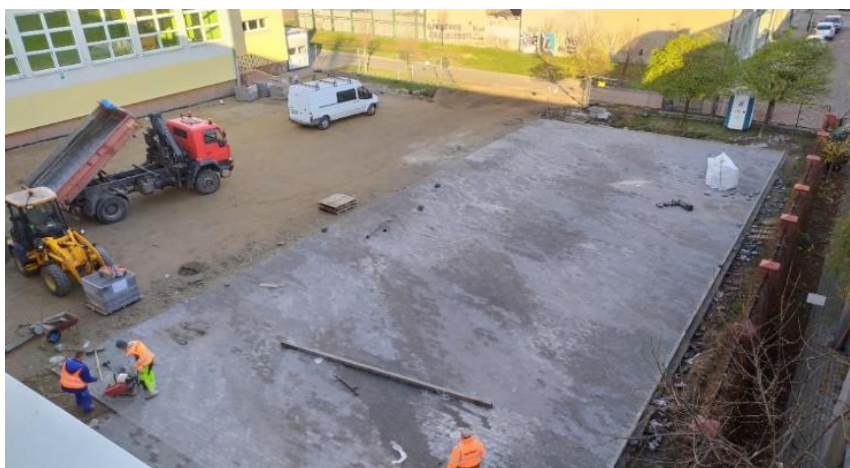
Fot. 9. Prace na terenie Szkoły Podstawowej nr 3 (stan z listopada 2019 r.)

W 2019 r. został wykonany w całości remont nawierzchni placu apelowego o powierzchni 1045 m 2 wraz z przebudową schodów wejściowych do budynku szkoły o powierzchni 49 m 2 (fot. 9.). Teren został przekazany do użytkowania. Z danych uzyskanych od Wydziału Inwestycji Urzędu Miasta Włocławek koszt ww. robót wraz niezbędną dokumentacją wyniósł łącznie 251 150,00 zł.