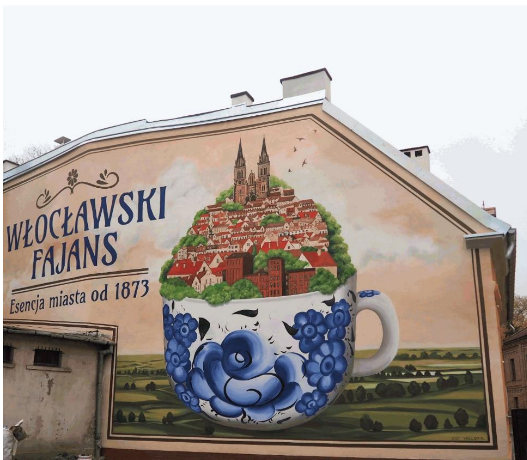
Fot. 6. Mural wykonany w 2020 r. na ścianie bocznej budynku przy ul. Wojska Polskiego 3 we Włocławku w ramach przedsięwzięcia pn. Sztuka w przestrzeni – Program Murale (1.3.8.)

Realizacja projektu ma przyczynić się do poprawy wizerunku obszaru rewitalizacji, zwiększenia jego atrakcyjności dla osób tu mieszkających, jak i pozostałych mieszkańców miasta, jako miejsca ściśle związanego z historią miasta. Jego efekty będą miały pozytywny wpływ na atrakcyjność turystyczną obszaru.