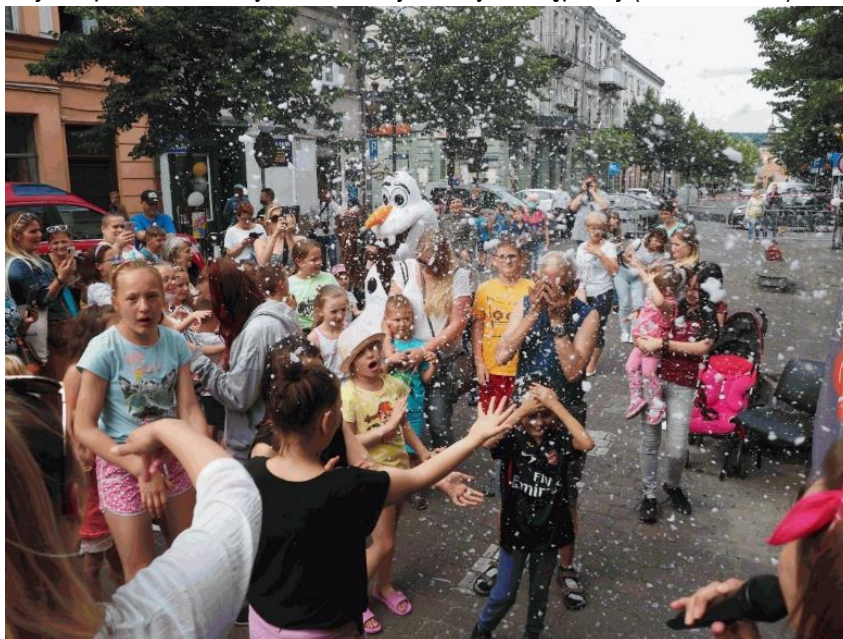
Fot. 3. Śródmiejskie powitanie wakacji realizowane przez operatora kawiarni obywatelskiej „Śródmieście Cafe” w ramach przedsięwzięcia Kawiarnia obywatelska (1.1.10.)