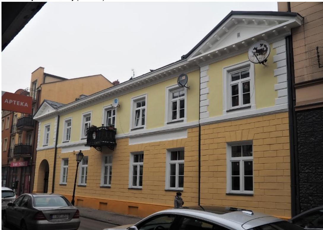
Fot. 11. Remont elewacji wraz z wymianą stolarki okiennej i drzwiowej w ramach projektu Modernizacja i remont nieruchomości "Piekarska 6" (4.1.2.11.)

W 2020 r. przygotowano dokumentację projektowo-kosztorysową i uzyskano pozwolenie na budowę. W wyniku wyłonienia wykonawcy w przetargu nieograniczonym został wykonany remont elewacji i wymiana stolarki okiennej i drzwiowej (fot. 11.).