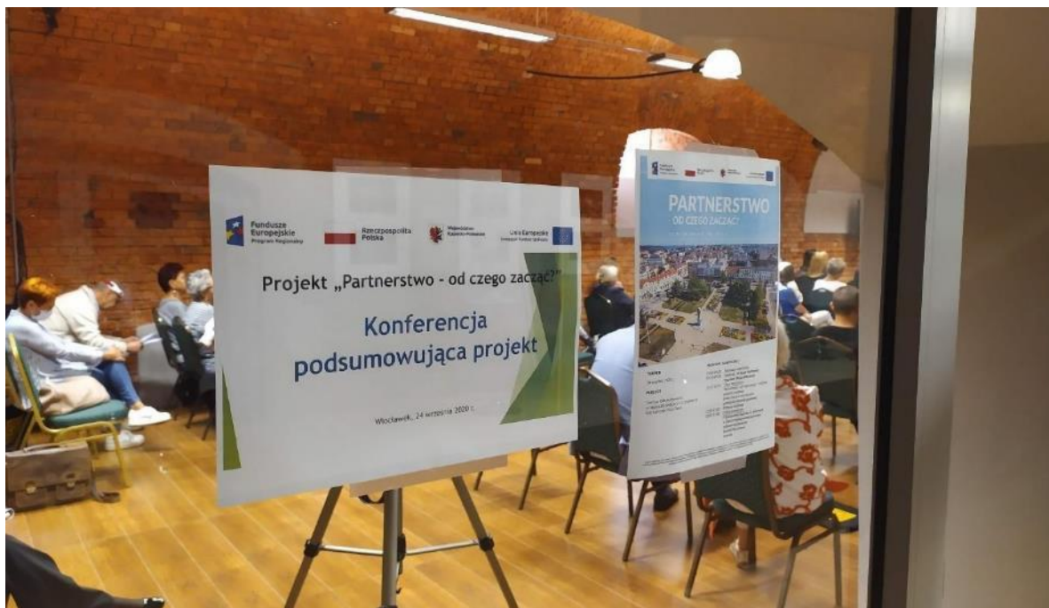
Fot. 17. Konferencja podsumowująca projekt „Partnerstwo – od czego zacząć?” w dniu 24.09.2020 r.

Projekt obejmował działania edukacyjne z zakresu rewitalizacji społecznej, w tym działania animacyjne oraz wspierające aktywizację społeczno – zawodową osób zagrożonych ubóstwem bądź wykluczeniem społecznym i osób z ich otoczenia poprzez realizację: warsztatów, poradnictwa indywidualnego, wizyty studyjnej, konferencji oraz wykonanie badań wraz z opracowaniem diagnozy w zakresie nawiązywania partnerstw publiczno – społecznych (fot. 17., fot. 18.).