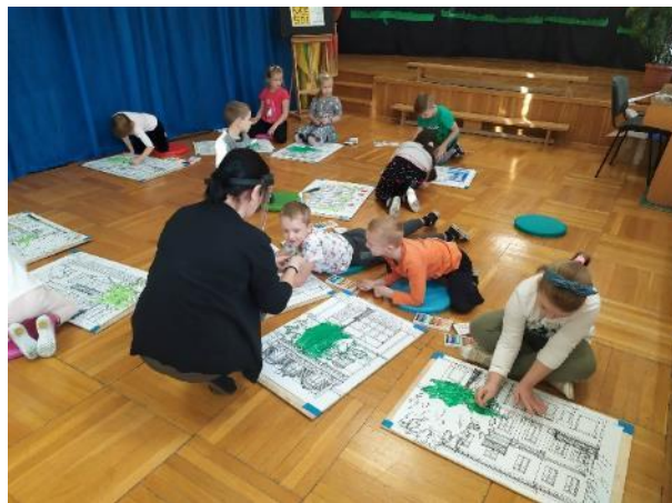
Fot. 2. Prelekcja w czasie realizacji mikrograntu pn.: Plenerowe warsztaty twórcze „Kamienice Śródmieścia”

W czasie prelekcji omówiono znaczenie tego typu obiektów, ich funkcje, podkreślając ich różnorodność oraz potrzebę rewitalizacji i konieczność dbania o dziedzictwo architektoniczne i przestrzeń publiczną w naszym mieście. Prace młodych twórców wraz z aktualnymi fotografiami kamienic zostały udokumentowane w postaci folderu. Partnerem Galerii Sztuki Współczesnej było Przedszkole Publiczne nr 8 z Oddziałami Integracyjnymi we Włocławku.