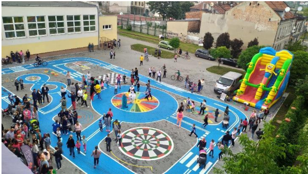
Fot. 10. Miasteczko wraz z planszami do gier podwórkowych zrealizowane w 2020 r. w ramach przedsięwzięcia pn. Trójka dla mieszkańców (3.1.7.)

W 2020 r. zlecono wykonanie projektu technicznego miasteczka ruchu drogowego, zrealizowano miasteczko wraz z planszami do gier podwórkowych (fot. 10.). Zakupiono również zestaw przenośnych znaków drogowych i kasków rowerowych dla uczniów.