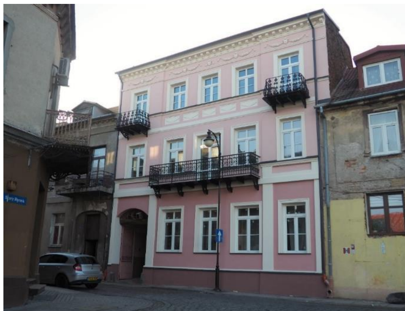
Fot. 13. Remont elewacji i dachu budynku frontowego, oficyny, wewnętrznej kanalizacji ogólnospławnej w budynku przy ul. Łęskiej 79 w ramach przedsięwzięcia „Dotacje do remontów (4.1.4.)