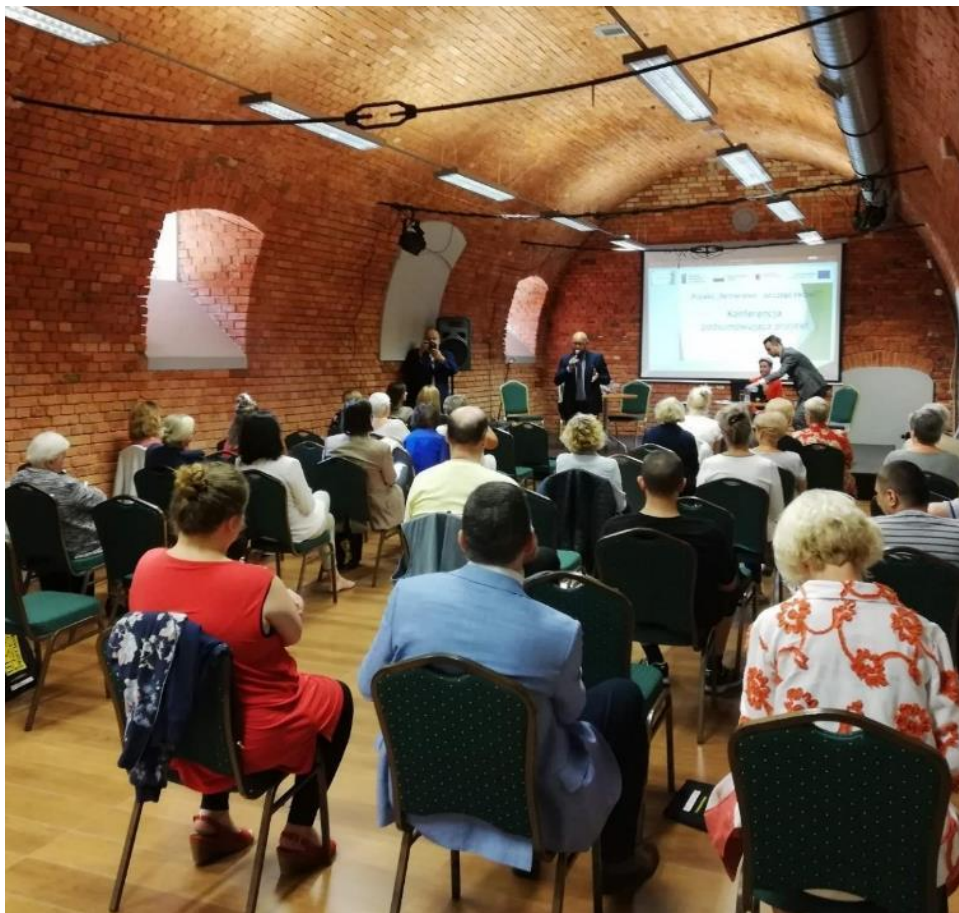
Fot. 18. Konferencja podsumowująca projekt „Partnerstwo – od czego zacząć?” w dniu 24.09.2020 r.

Całkowita wartość projektu wyniosła 55 290,00 zł, w tym kwota dofinansowania - 50 000,00 zł i wkład własny niepieniężny Miasta o wartości 5 290,00 zł. W ramach projektu osiągnięto następujące wskaźniki: