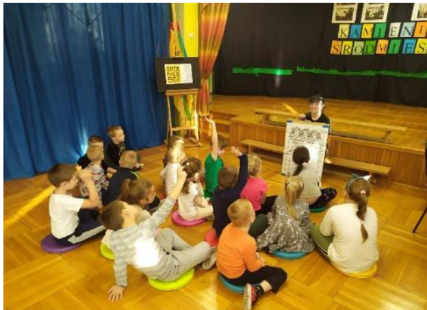
Fot. 1. Warsztaty plastyczne w czasie realizacji mikrograntu pn.: Plenerowe warsztaty twórcze „Kamienice Śródmieścia”

Z uwagi na zaistniałą sytuację sanitarno-epidemiologiczną związaną z COVID-19, wprowadzone obostrzenia oraz ograniczenia dotyczące wydatkowania środków z budżetu miasta, w 2020 r. został zrealizowany 1 mikrogrant (w okresie od lipca do grudnia 2019 r. zostało zrealizowanych 7 mikrograntów). Pomiędzy Gminą Miasto Włocławek a Galerią Sztuki Współczesnej we Włocławku zawarte zostało porozumienie na realizację projektu pn.: Plenerowe warsztaty twórcze „Kamienice Śródmieścia”. Projekt polegał na organizacji warsztatów plastycznych skierowanych do dzieci przedszkolnych, które poprzedziła rozmowa na temat włocławskiej architektury, w tym kamienic (fot. 1., fot. 2.).