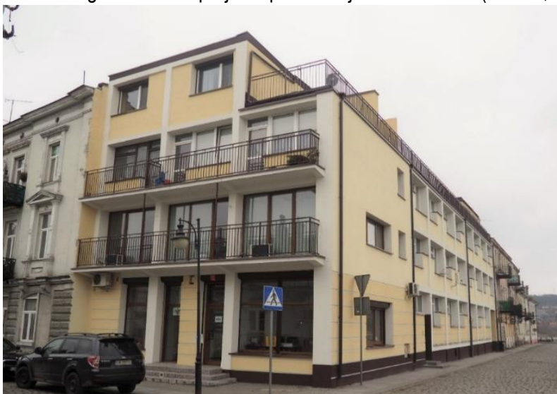
Fot. 12. Remont elewacji, wymiana balustrad tarasowych i balkonowych, przemurowanie komina w budynku przy ul. Maślanej 8/10 w ramach przedsięwzięcia „Dotacje do remontów (4.1.4.)

Poniżej zamieszczono fotografie wybranych nieruchomości położonych w SSR, na których remont udzielono wsparcia finansowego w ramach projektu pn. Dotacje do remontów (fot. 12., fot. 13., fot. 14.).