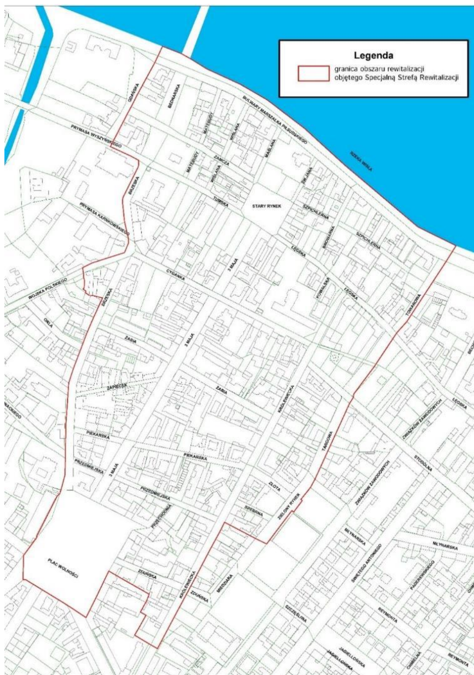
Rycina 1. Granice obszaru rewitalizacji objętego Specjalną Strefą Rewitalizacji

Gminny Program Rewitalizacji Miasta Włocławek na lata 2018-2028 przyjęty uchwałą Rady Miasta Włocławek w dniu 17 lipca 2018 r. jest systemem wielu zintegrowanych działań o zróżnicowanym charakterze, służących wyprowadzeniu obszaru rewitalizacji Śródmieścia ze stanu kryzysowego poprzez osiągnięcie wyznaczonych w nim czterech celów strategicznych.