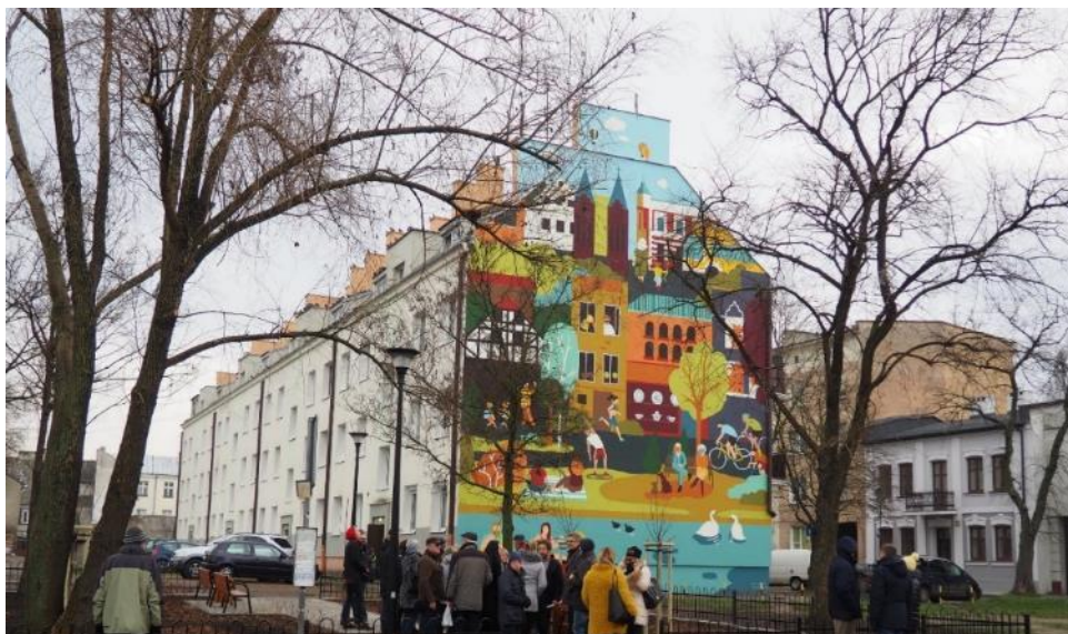
Fot. 15. Spacer Komitetu Rewitalizacji wraz z zainteresowanymi mieszkańcami po obszarze rewitalizacji w dniu 14.01.2020r.

Z uwagi na panującą sytuację sanitarno-epidemiologiczną związaną z pandemią COVID-19 i wprowadzonymi obostrzeniami w 2020 r. odbyły się tylko 3 posiedzenia Komitetu Rewitalizacji, w tym 14 stycznia 2020 r. w formie spaceru po obszarze rewitalizacji (fot. 15., fot. 16.). Uczestniczący Członkowie Komitetu Rewitalizacji i zainteresowani mieszkańcy zapoznali się z dotychczasowymi rezultatami projektu pn.: „Dotacje do remontów” (nr 4.1.4.) dedykowanego dla nieruchomości położonych w Specjalnej Strefie Rewitalizacji, zaawansowania prac w projekcie pn.: „Centrum Wsparcia Społecznego” (nr 4.1.6.) u zbiegu ulic Piekarskiej i Brzeskiej. Uczestnicy zobaczyli również efekty konkursu na mural w obszarze rewitalizacji, umieszczonego