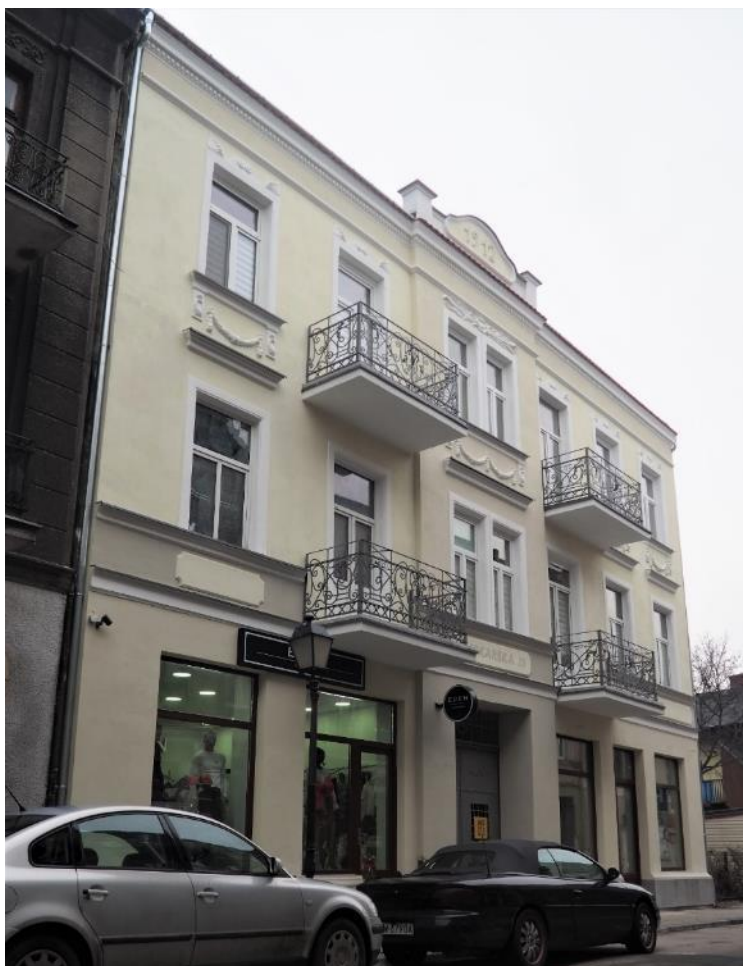
Fot. 14. Remont elewacji frontowej, wymiana konstrukcji dachu oficyny zachodniej, wymiana sieci elektrycznej do zabezpieczeń wewnętrznej instalacji do lokali w budynku przy ul. Piekarskiej 15 w ramach przedsięwzięcia „Dotacje do remontów (4.1.4.)

W celu ułatwienia poruszania się po przyjętym systemie dotacji, w 2019 r. opracowany został przewodnik po dotacjach pn.: „Jak uzyskać dotację na remont lub przebudowę oraz prace konserwatorskie i restauratorskie nieruchomości położonej w Specjalnej Strefie Rewitalizacji Miasta Włocławek?”. Wartość wydruku 3 000 egzemplarzy wyniosła 1 770,00 zł. Co roku odbywają się również dyżury informacyjne dla zainteresowanych właścicieli i użytkowników wieczystych nieruchomości dotyczące systemu miejskich dotacji do remontów w Specjalnej Strefie Rewitalizacji.