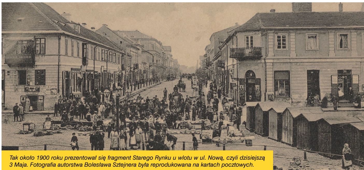
Tak około 1900 roku prezentował się fragment Starego Rynku u wlotu w ul. Nową, czyli dzisiejszą 3 Maja. Fotografia autorstwa Bolesława Sztejnera była reprodukowana na kartach pocztowych.

wraz z pracownikami Wydziału Rewitalizacji Urzędu Miasta Włocławek