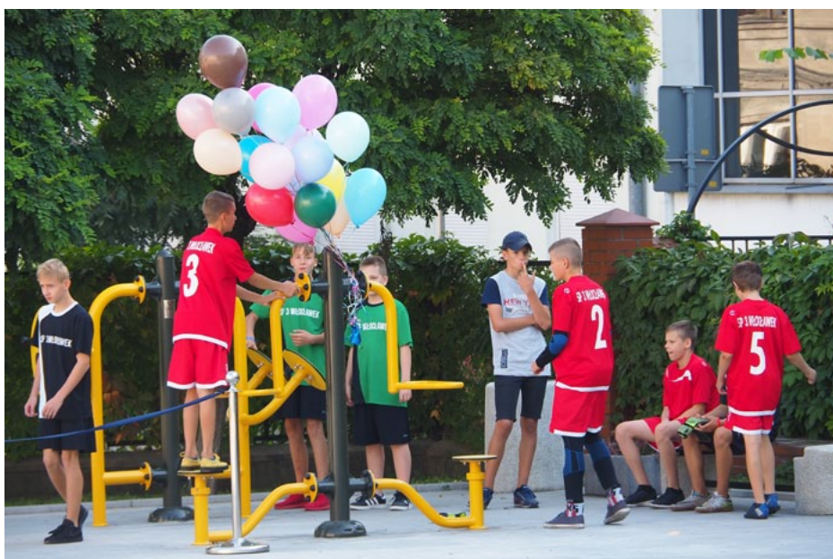
Piknik Integracyjno-Sportowy w Szkole Podstawowej nr 3 przy ul. Cyganka. Podczas wydarzenia zainaugurowano cykl spotkań ze sportem organizowanych przez Uczniowski Klub Sportowy „Meta”.

działalności Uczniowskiego Klubu Sportowego istniejącego przy naszej placówce organizujemy zajęcia z piłki nożnej, piłki ręcznej, siatkówki, koszykówki, oraz innego rodzaju