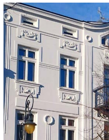
To tylko fragment wspaniałej elewacji budynku.

Nowy punkt na rewitalizacyjnej mapie Śródmieścia to przede wszystkim przyszła siedziba kawiarni obywatelskiej "Śródmieście Cafe" i Wydziału Rewitalizacji. – W tym miejscu będziemy się spotykać z mieszkańcami, by wspólnie debatować nad tym, co już udało się zrobić i jakie jeszcze działania z zakresu rewitalizacji społecznej przed nami. Z radością zaprosimy Państwa do tej pięknej, inspirującej przestrzeni – mówi zastępca prezydenta Monika Jabłońska, pełnomocnik ds. rewitalizacji.