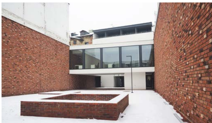
Kamienica przy ul. 3 Maja 18 – widok na dziedziniec.

Szeroko zakrojona przebudowa kamienicy przy ul. 3 Maja 18 pozwoliła stworzyć niezwykłą siedzibę przyszłego Centrum Aktywizacji i Przedsiębiorczości, wpisanego do Gminnego Programu Rewitalizacji Miasta Włocławek na lata 2018-2028. To tu, na mierzącej blisko tysiąc metrów kwadratowych nieruchomości funkcjonować będzie nowoczesna przestrzeń służąca wszystkim mieszkańcom Włocławka.