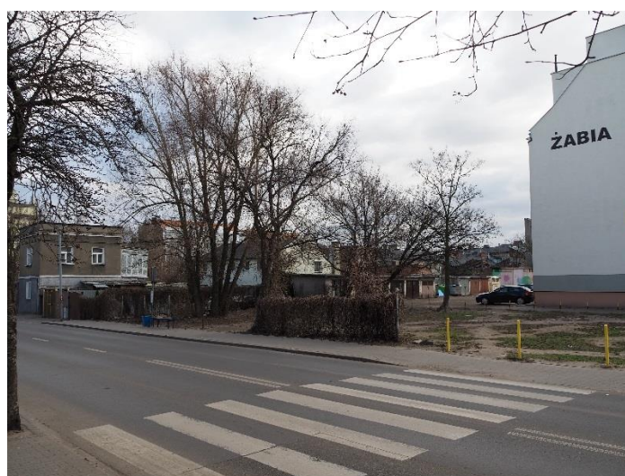
Rycina 5. Stan obecny nieruchomości przy ul. Brzeskiej – przyszły park kieszonkowy