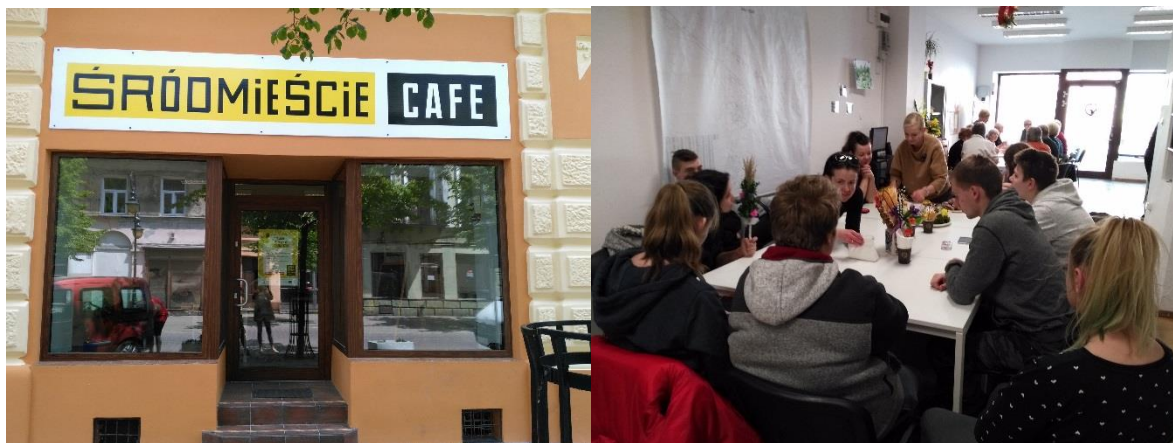
Rycina 3. Kawiarnia obywatelska „Śródmieście Cafe”

Standardy funkcjonowania kawiarni obywatelskiej są nie tylko wykorzystywane przez kolejnych operatorów „Śródmieście Cafe”, ale również z konkursu na konkurs udoskonalane i ulepszane – dzięki zawartym rekomendacjom.