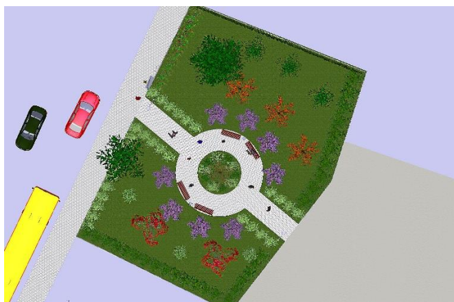
Rycina 4. Wizualizacja parku kieszonkowego przy ul. Brzeskiej we Włocławku