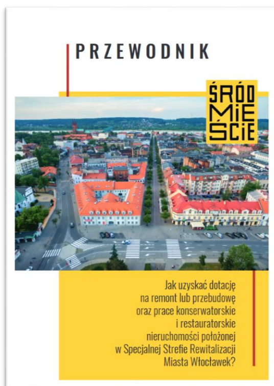
Rycina 6. Przewodnik po dotacjach na remont lub przebudowę w Specjalnej Strefie Rewitalizacji.