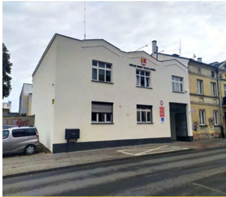
ul. Królewiecka 7