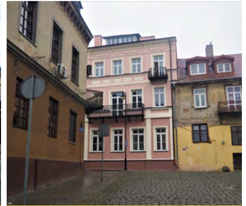
ul. Łęgska 79