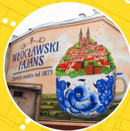
WOJSKA POLSKIEGO 3

#SZLAKIEMŚRÓDMIEJSKICHMURALI #REWITALIZACJA #WŁOCŁAWEK