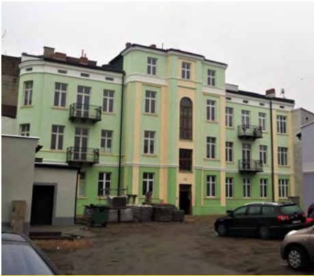
ul. 3 maja 30