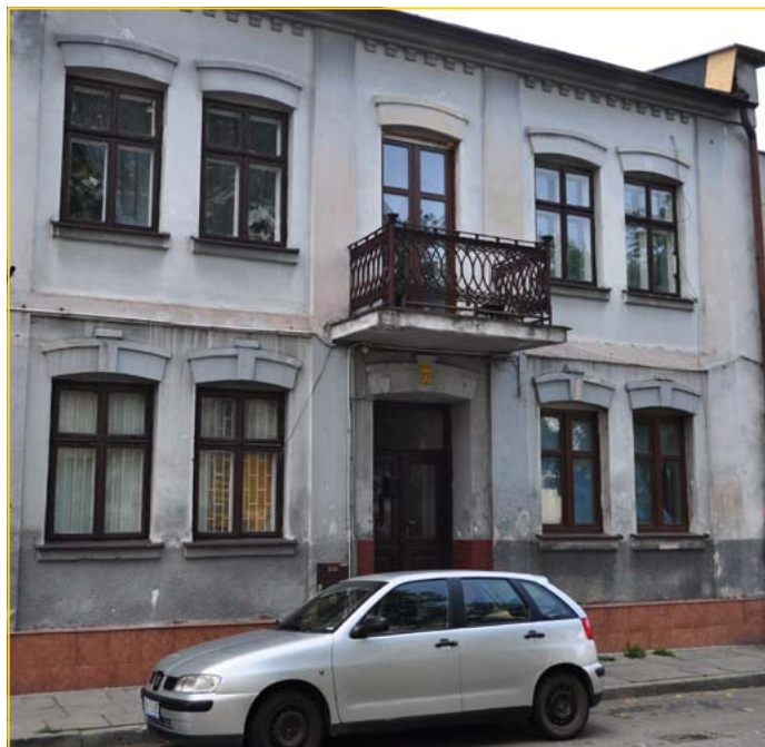
ul. Żabia 27, kwota dofinansowania: 13 577,20 zł