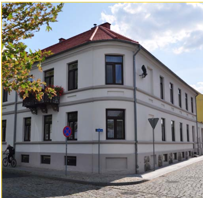
ul. Bulwary 18, kwota dofinansowania: 38 939,68 zł