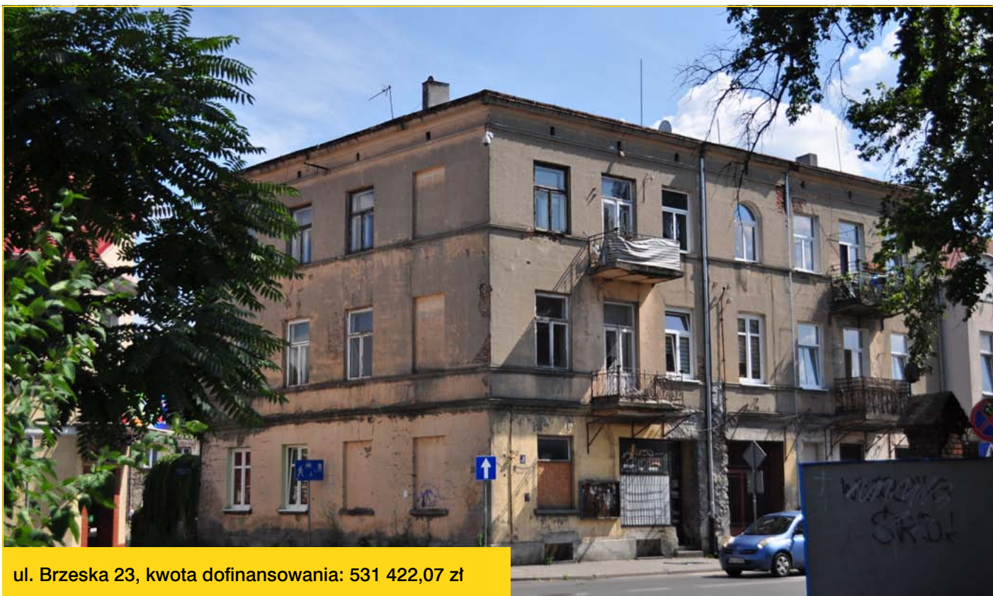
ul. Brzeska 23, kwota dofinansowania: 531 422,07 zł

powołaną przez Prezydenta Miasta Włocławek (1 wniosek wpłynął po terminie). W wyniku weryfikacji, Komisja rekomendowała 6 wniosków do podpisania umów o dotację.