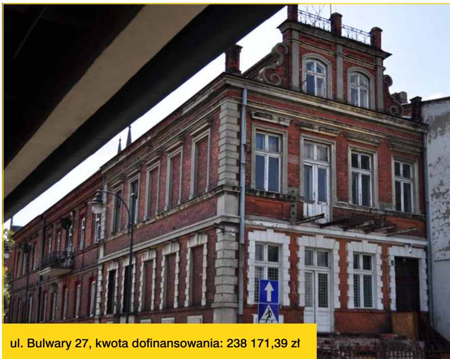
ul. Bulwary 27, kwota dofinansowania: 238 171,39 zł

Kolejnym etapem związanym z realizacją dotacji jest podpisanie umów z wnioskodawcami. Realizacja prac i rozliczenie dotacji przez właścicieli lub użytkowników wieczystych nieruchomości nastąpi jeszcze w tym roku.