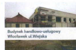
Budynek handlowo-usługowy Włocławek ul. Wiejska

Adres: Wiklinowa Kod pocztowy: 87-800 Włocławek Powierzchnia całkowita: 15,3897 ha Funkcja: Nieruchomości przemysłowe