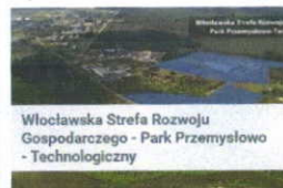
Włocławska Strefa Rozwoju Gospodarczego - Park Przemysłowo - Technologiczny

Adres: Wiklinowa Kod pocztowy: 87-800 Włocławek Powierzchnia całkowita: 15,3897 ha Funkcja: Nieruchomości przemysłowe